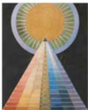
1.7.2020 Hilma af Klint – Konstnär, forskare, medium förlängs till 21 februari 2021

För ett år sedan gick den traditionella julresan till bl.a till Museet Arken och Picassoutställningen där. Tyvärr blev det ingen julresa i år. Vi får leva på de fina minnen som finns från Julresan 2019 och hoppas på att få återuppta denna tradition 2021.