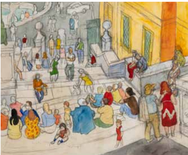
Hilding Linnqvist, På väg till la Bareaceri, 1910-tal

Utställningens syfte är att visa skissens betydelse som en omistlig del av Hilding Linnqvists konstnärliga process, som resulterade i en karaktäristisk, oförglömligt färgsprakande bildvärld med en mängd olika motiv och teman.