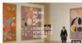
Hilma af Klint | Introduktion med Iris Müller-Westermann Moderna Museet Malmö - 8 061 visningar - för 7 månader sedan