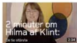
Hilma af Klint | De tio största Moderna Museet Malmö - 1 842

Konstresan till Malmö/Lund har också fått ställas in. Under rådande omständigheter kommer inga resor att kunna genomföras. Det finns en möjlighet att se Moderna museets utställning digitalt via deras hemsida www.modernamuseet.se/malmo